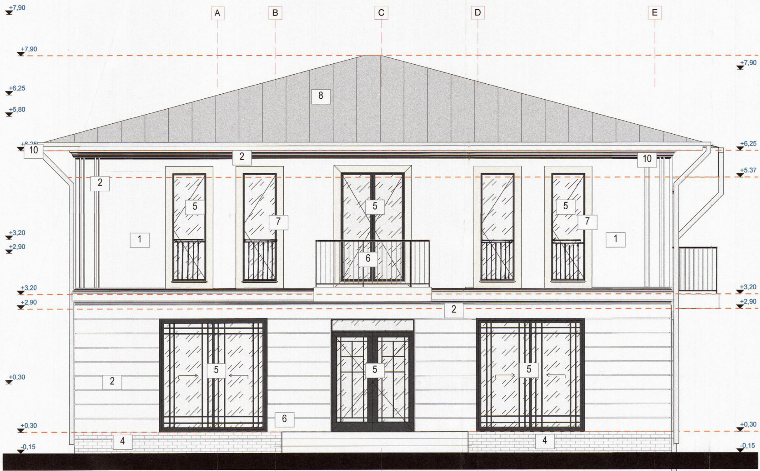
FATADA NORD EST (LATERALA DREAPTA)