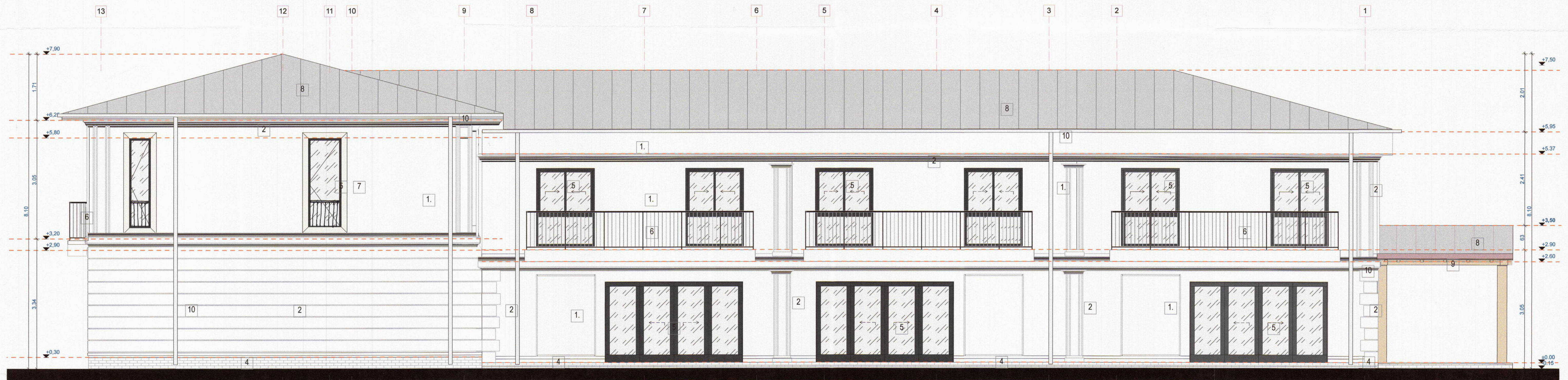
FATADA NORD VEST (FATADA POSTERIOARA)