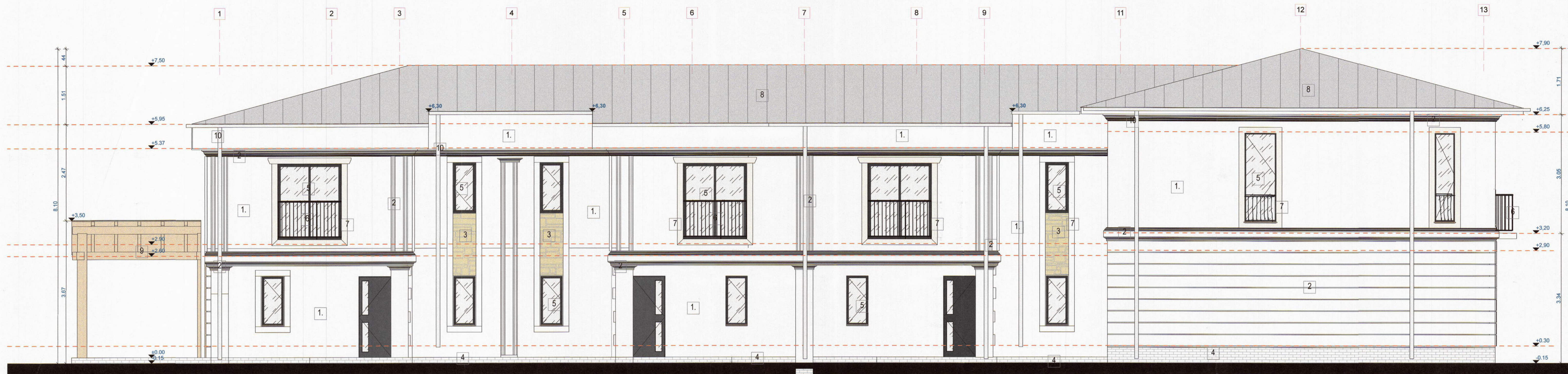
FATADA SUD EST (PRINCIPALA)